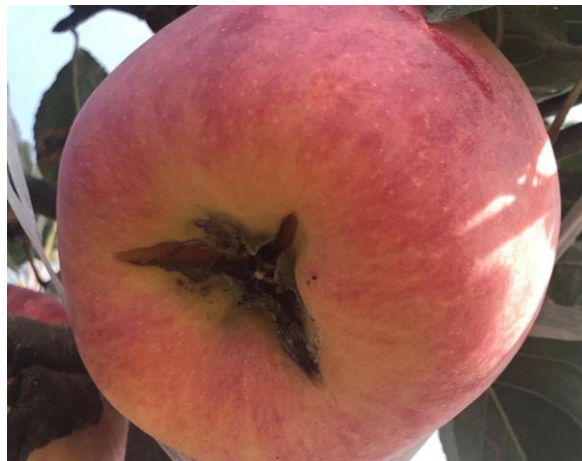
图 24-5 苹果裂果病的症状

裂果主要发病部位在苹果梗洼和果肩处，胴部较轻。有些裂纹从果柄处开始向两边开裂至梗洼上部，有的在梗洼处围绕果柄形成若干小皱裂，有的在梗洼内以果柄为圆心弧形开裂。此病在果实成熟期遇高温干旱天气时以及在贮藏期间不仅易失水发绵，而且易感染其他病害腐烂。