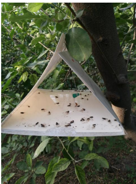
图 24-1 三角粘板式诱捕器

新、老果园各采用棋盘式取样法悬挂性诱捕器和糖醋液（1 个性诱捕器和 1 盆糖醋液为 1 个小组，每个果园每组重复 3 次）。诱捕器和糖醋液间距均大于 20 m，以防止之间相互影响。