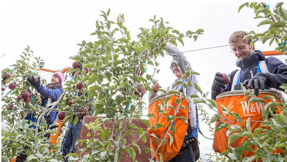
图 24-7 青年农民培养计划

与过去一样，WTFRC 将继续与该行业的所有部门保持联系，与其他果树行业组织密切合作，促进实践中的研究项目，并与后辈专业人员进行有效接触，以此应对当前和未来果树生产者面临的挑战。实际上，史密斯相信未来已经开始。她说：“这是正在进行的，因为种植者对我们目前已制定的研究计划进行了投资。”