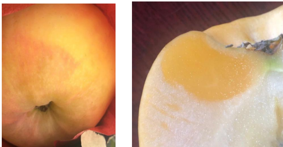
图 24-4 苹果水心病的症状

苹果水心病又称糖化病、蜜果病。它是一种苹果生理病害，多发生在果实成熟后期及贮藏期。水心病的病斑在果心部和维管束附近发生较多，也可在果肉的任何部位发生，使发病果实果肉组织坚硬，呈水渍状，以果心及其附近发病较重，病部组织沿苹果心室射线由内向外扩展，病果细胞间隙充满了一种透明的水渍状物质。发病严重时，在果实外部可见病斑，病果皮呈水渍状，贮藏期最后果肉变软腐烂。