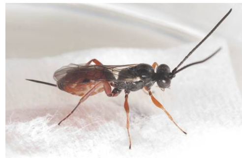
图 2-2 小黄蜂 ( Mastrus ridens )