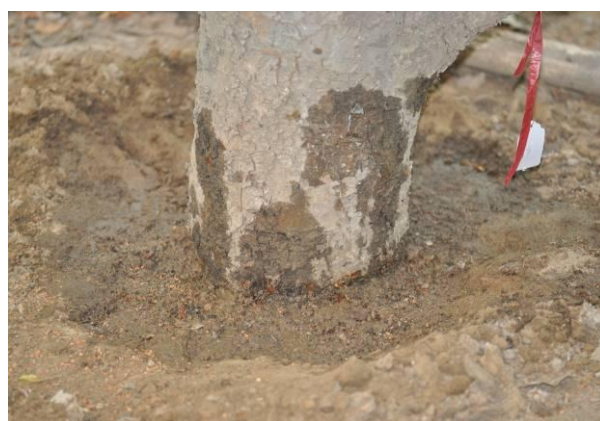
图 3-1 药带法防控苹果绵蚜图示

(左图：先挖环沟到根分叉处，将绵蚜药带敷到树皮上，再覆土；右图：处理后浇水，再覆土)