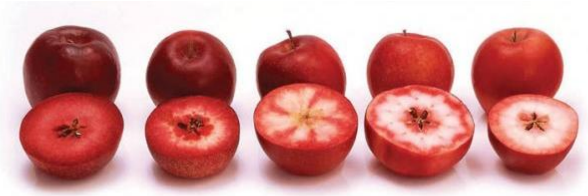
图 3-2 从粉色到深红的苹果 (IFORED)

“Next Big Thing” 公司总裁 Tim Byrne 说, IFORED 是在 2012 年 10 月水果营销商在 IFO 的法国总部会面时创立的。该合作组织将对红色果肉苹果品种进行试验、筛选, 并将其商业化。Byrne 说, 位于美国和加拿大东部的一些公司成员将会在 2013 年春天种植红色果肉苹果品系。他说, 在接下来的两年时间里, 3 个或者 4 个农场将栽培 10 到 15 个红色果肉苹果品系, 寻找那些具有商品化潜力的 (品系)。