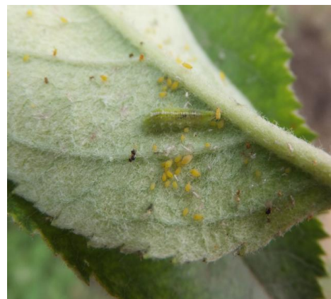
图 11-16 取食蚜虫的食蚜蝇幼虫