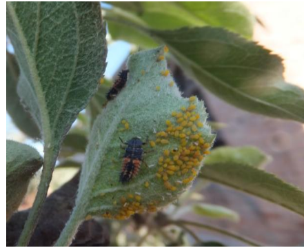
图 11-12 取食蚜虫的瓢虫幼虫