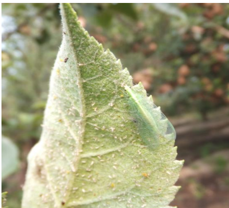
图 11-15 取食蚜虫的草蛉