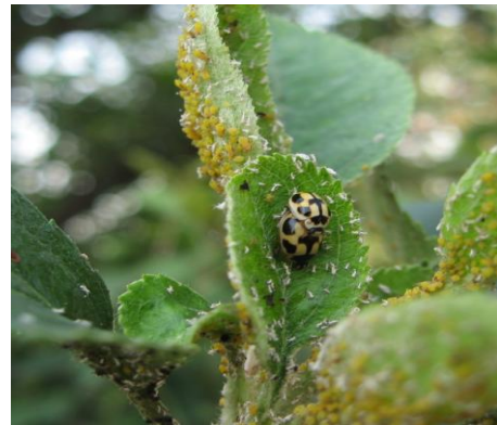
图 11-14 取食蚜虫的龟纹瓢虫