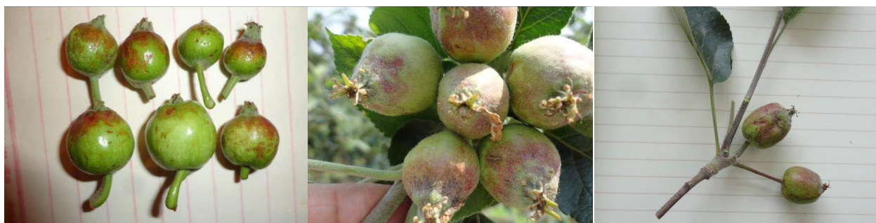
图11-1 绥中大王庙乡果园寒富幼果

2、木栓型。花后20天到采前，果肉发生水渍状病斑，渐变褐色，海绵状，呈条状分布，幼果期发病多集中于近萼端，果实畸形、早落。生长后期，果面略现凹凸不平，并有松软感，果肉不堪食用，丧失经济价值。