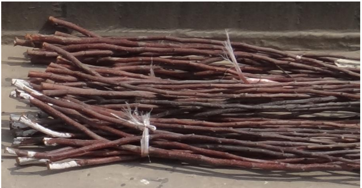
图11-9 冬剪时剪下的枝条，刚剪下时枝条表面光滑