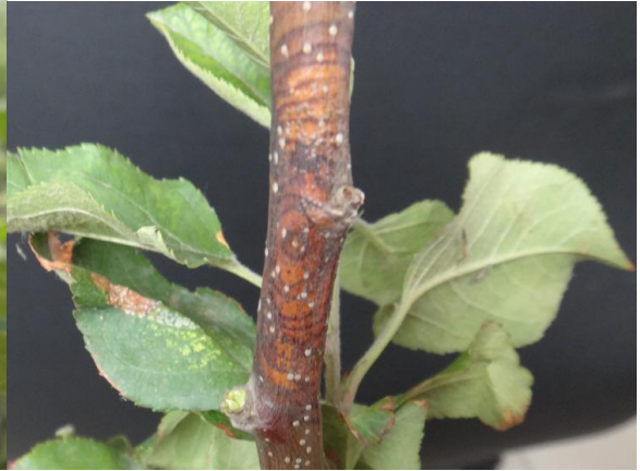
图11-5 6月份轮纹病病斑的扩展