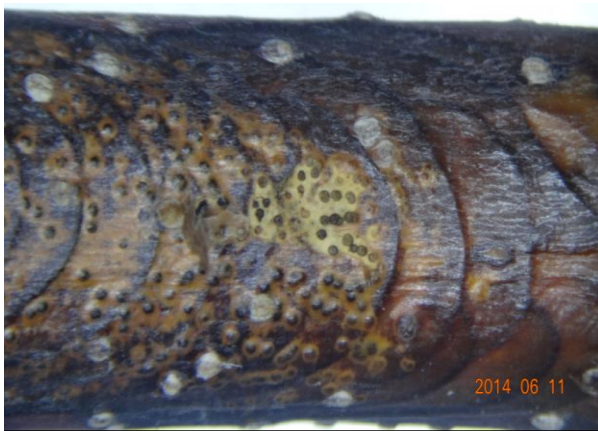
图11-6 枝干轮纹病病斑上出现小黑点