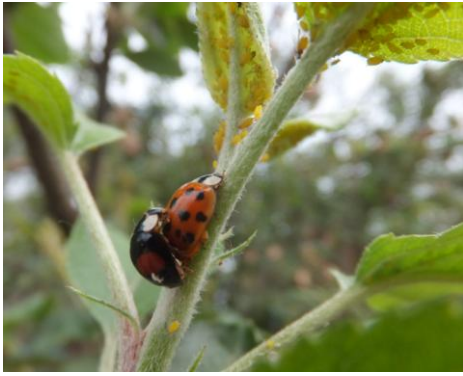
图 11-11 正在交尾的异色瓢虫