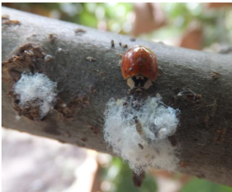
图 11-13 异色瓢虫在取食苹果绵蚜