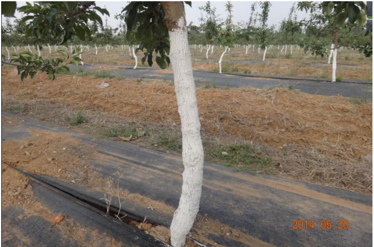
图11-8 苹果树主干涂抹轮纹终结者后的状况