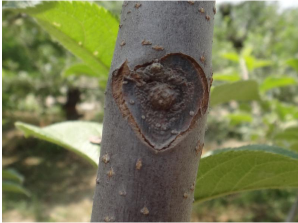
图11-4 幼树中心干上形成的轮纹病病瘤