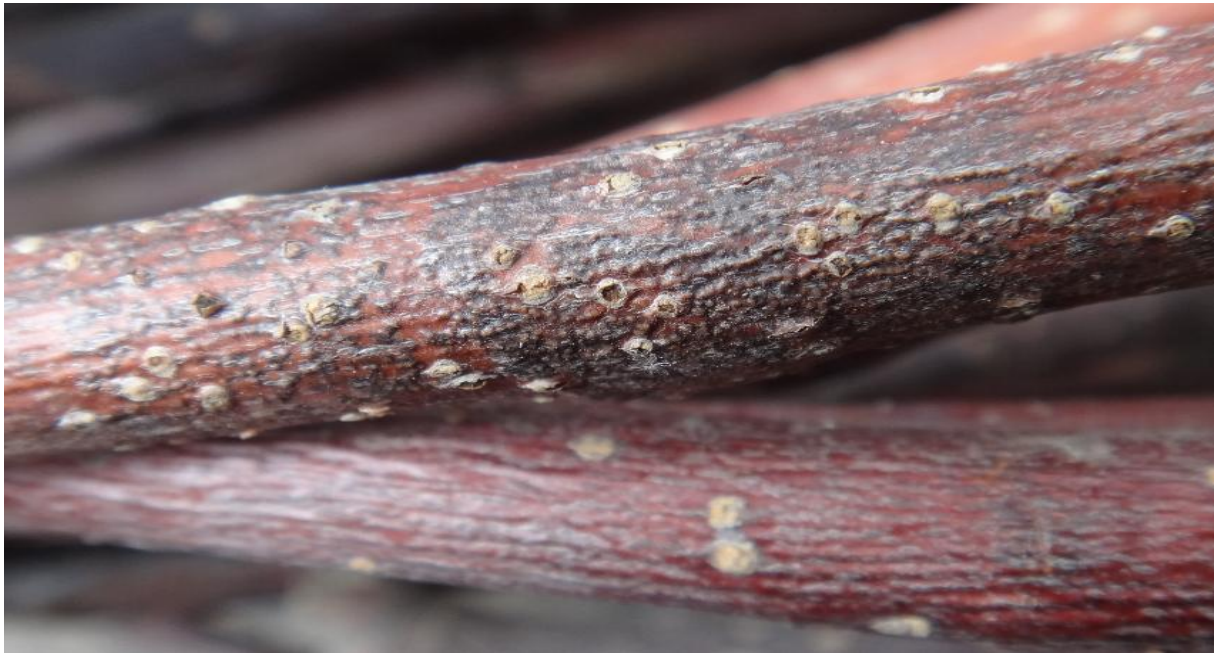
图11-10 冬剪下的枝条放置到6月份在高温和降雨的条件下形成了大量轮纹病的分生孢子器（小黑点）

6月份冬春季节被剪下的枝条也开始形成大量的分生孢子器（图 11-9，图 11-10），因此，要将这些枝条移到远离果园的地方，以防分生孢子随风雨传播到果树上造成新的侵染。