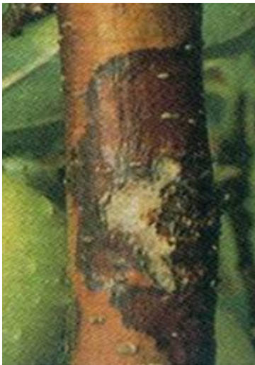
图 2 干腐病症状（溃疡）

2、在枝干上，两种病原菌致病性显著差别，引起不同症状。葡萄座腔菌 B. dothidea 引起小型病瘤，大小为 0.7-1.0 mm（图 3）。粗皮葡萄座腔菌 B. kuwatsukai 引起大型病瘤，大小为 3-4 mm（图 3），随着病瘤的不断增多及开裂，最后发展成为粗皮症状，在干旱胁迫条件下表现为溃疡症状，建议将该类症状称为粗皮病。