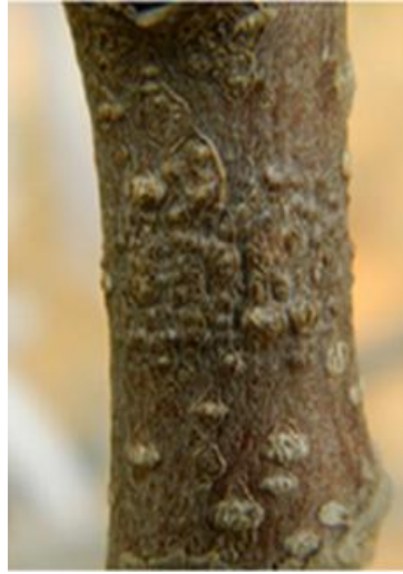
图 3 葡萄座腔菌引起树干上的小型病瘤症状