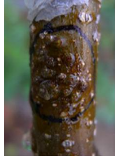
图 4 粗皮葡萄座腔菌引起的树干大型病瘤症状

3、在果实上及枝干上，两种病原菌都普遍发生，而且致病性存在显著差异，因此建议在苹果轮纹病发生规律、抗病育种等研究中，对两种病原菌都要予以重视。