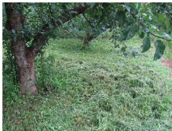
图 15-2 自然生草刈割果园覆盖效果