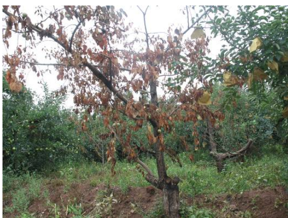
图 15-3 展叶后因贮藏营养消耗殆尽尸体死亡