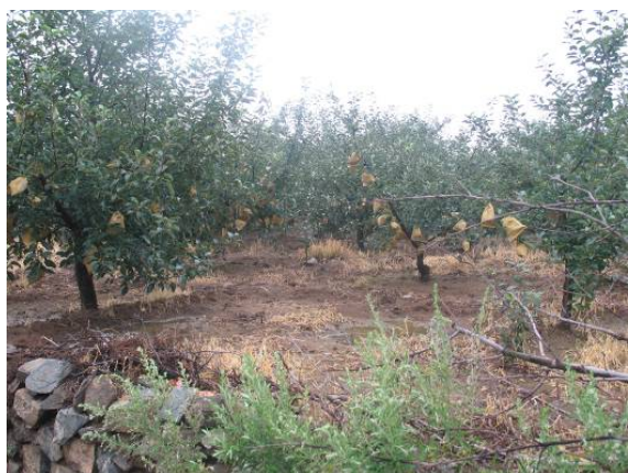
图 15-1 多年使用除草剂的果园缺株现象

苹果褐斑病是造成早期落叶、削弱树势的主要病害，应在套袋后立即喷 1:3:200 波尔多液，根据雨水洗刷情况，多次使用波尔多液。当出现落叶现象后改用戊唑醇或苯醚甲环唑。