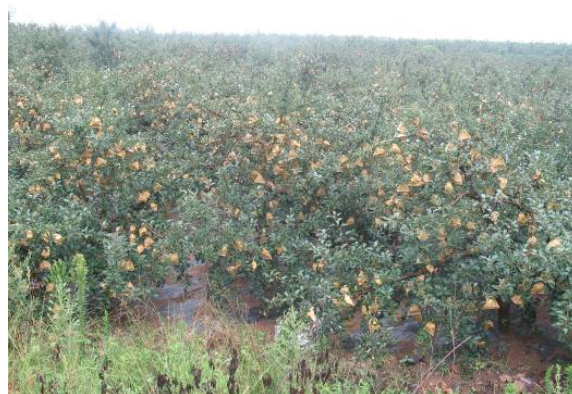
图 15-4 健壮生长的果园