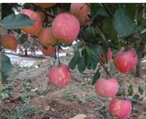
图 20-4 苹果锈果病病果症状