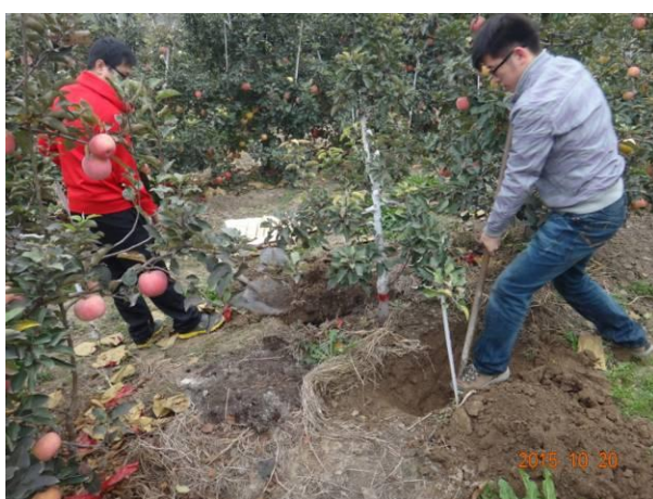
图 20-3 对苹果锈果并开展施肥防控试验