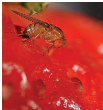
图 20-13 地中海实蝇和斑翅果蝇是 Oxitec 公司正在计划用 RIDL 控制的害虫