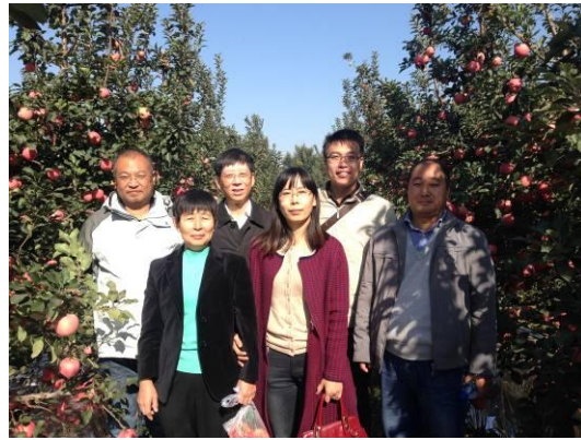
图 20-11 苹果产业技术体系团队成员合影