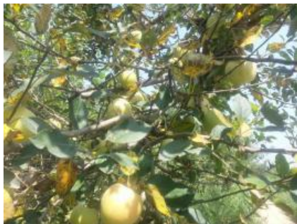
图 20-1 炭疽叶枯病在树冠上的表现

近年来, 由于多雨等异常天气的增加, 咸阳苹果产区遭受到一种由真菌引起的新病害-炭疽叶枯病。表现为叶片上出现椭圆形、圆形、长条形的黄褐、红褐或深褐色斑点, 严重者多斑连片变褐、焦枯至叶片脱落; 果实上出现红褐色小点, 圆形或近圆形微凹陷的红褐色斑。主要发生在渭北南部的乾县、礼泉和兴平, 多在秦冠、嘎拉、金冠和乔纳金上发病, 严重影响苹果的产量和品质, 经西北农林科技大学植保学院鉴定为炭疽叶枯病。2015 年 8 月 28 日体系岗位专家孙广宇教授同团队成员对发病严重的礼泉县进行调研, 并根据发病情况制定了防治方法。