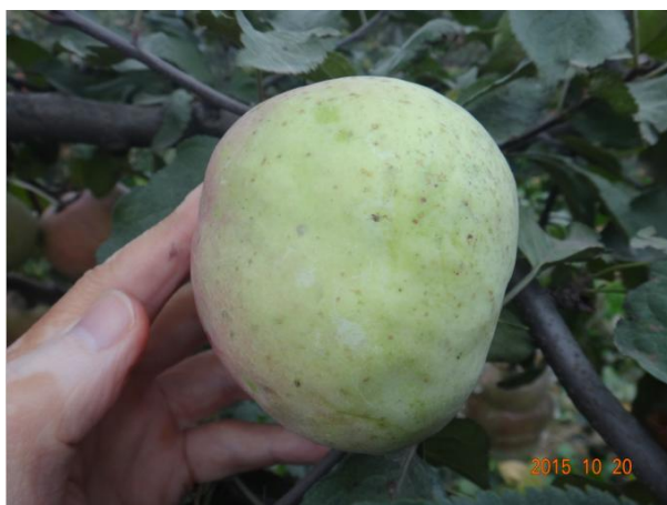
图 20-5 苹果锈果病表现严重的病果症状