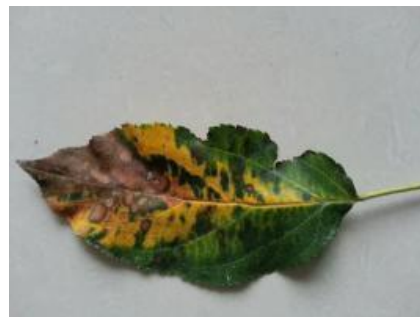
图 20-2 炭疽叶枯病在树叶上的症状