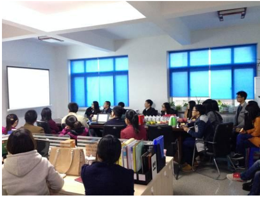
图 20-8 在木美土里公司进行交流