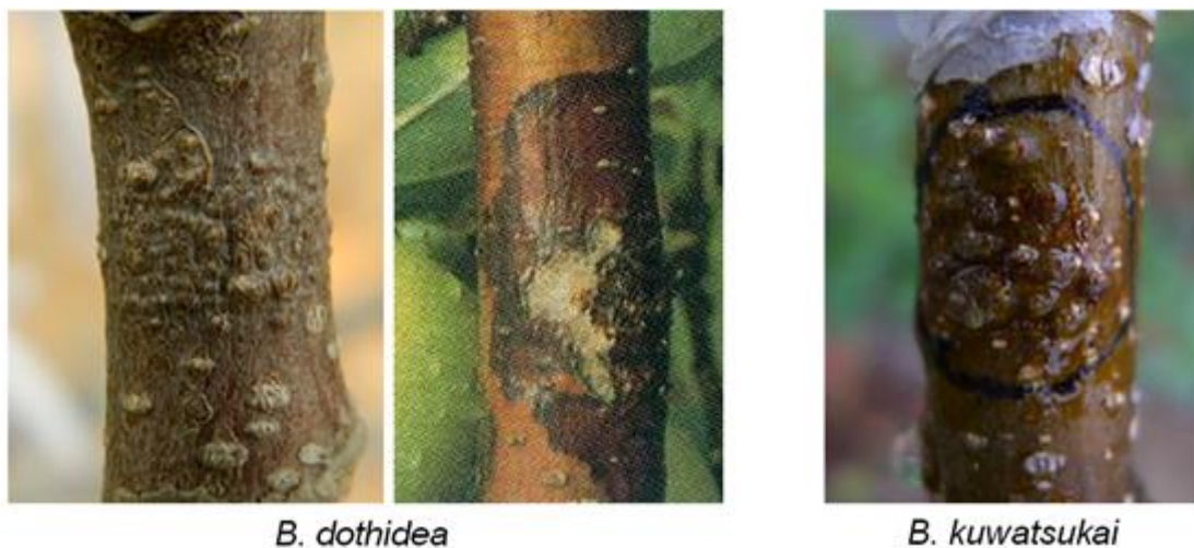
图 20-12 葡萄座腔菌（左）与粗皮葡萄座腔菌（右）引起苹果枝干溃疡症状差异

3. 在果实上及枝干上，两种病原菌都普遍发生，而且致病性存在显著差异，因此建议在苹果轮纹病发生规律、抗病育种等研究中，对两种病原菌都要予以重视。