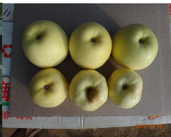
图 20-6 由缺硼导致的苹果缩果病（下层果）