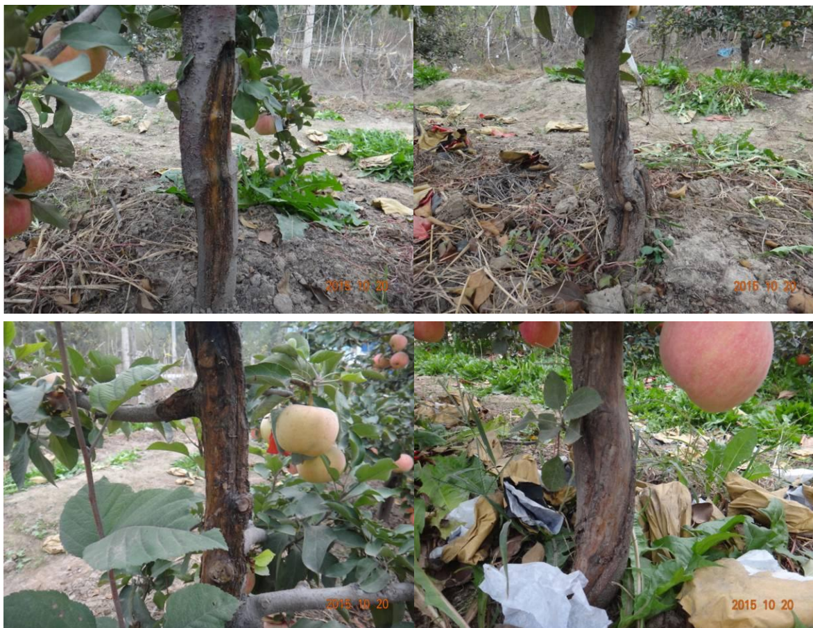
图 20-7 因输液不当对苹果树干造成的损伤

➤ 10月24日，应木美土里总经理刘镇的邀请，国家苹果产业技术体系病虫害防控研究室岗位专家曹克强教授携团队成员刘建玲教授、王树桐教授、王亚南副教授一行共19名师生赴秦皇岛木美土里技术研发部门进行了工作交流（图20-8）。四位教授分别就苹果树腐烂病、肥水管理、苹果再植病害、苹果锈果病等问题重点讲解，木美土里研发部门四位组长就近期工作内容以及试验中遇到的问题进行了讨论，为下一步的合作以及分工奠定了良好的基础，让学生们初步了解试验方向和就业前景。次日，曹克强教授一行前往河北省农林科学院昌黎果树研究所，在付友所长和赵同生老师的陪同下，对其下两个试验基地进行了考察，两位老师给学生们讲解了果园管理技术以及育苗情况（图20-9、图20-10、图20-11），使学生们学的很多专业知识。2012年和2014年该试验站所结果品曾连续两次获河北省优质果品鉴评金奖。