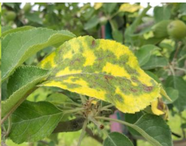
图 12-9 苹果褐斑病在叶片上的症状