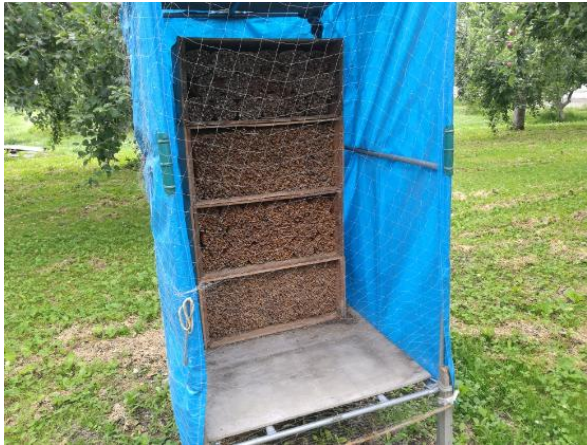
图 12-6 用于苹果授粉的壁蜂巢