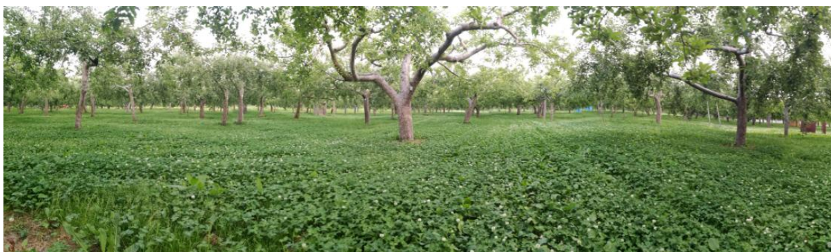
图 12-5 开心形并生草的乔砧稀植苹果园

青森的乔砧果园多为开心形（图 12-3），树体仅保留 3-5 个大枝，枝展可达 4-5 米，新建园株行距多为 3*5 米至 4*6 米，随着树体的长大，将树体分为临时株和永久株，通过去枝和间伐等措施，使得 20-30 年盛果期的果园密度仅为每亩十几棵。树体分枝粗壮，利用下垂枝结果，果形端正。由于日本果农以老人为多，采用这种树形不用高架梯子，仅用几阶矮凳就可以对果实进行管理操作，安全省力。由于叶丛较薄，叶面积指数多为 1.8-2，果园通风透光，有利于果实着色。果园以往主要采用人工授粉，现在多采用壁蜂授粉（图 12-4）。据果农介绍，90%以上的幼果要被去掉，一般每 50-80 片叶保留 1 个果实，盛果期亩产多维持在 2-2.5 吨左右，单产不是很高，但是特别注重果实的质量。果实采收一般分 2-3 次完成，富士品种的采收期在 11 月 15 日左右。套袋果实可以储存到来年 7-8 月，而不套袋苹果一般只能储存到来年 4-5 月，套袋果卖价更高。