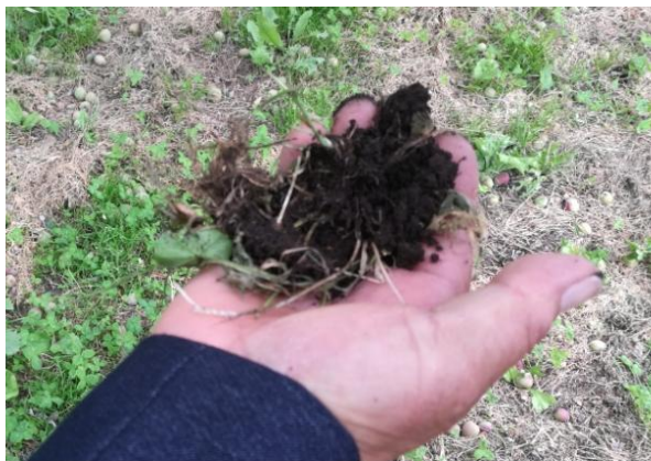
图 12-3 青森苹果园黑色土壤

以富士为主，占到 50%左右，其次是乔纳金、王林、津轻、世界第一、陆奥、北斗、信农丰等多个品种。果园土壤多由火山灰演化形成，呈现为黑色（图 12-1），有机质含量多在 3%-5%，丰富的土壤营养使得果树生长年限很长，很多树龄在 50-60 年的苹果树仍处于盛果期（图 12-2），优质果率可达到 80%-90%。据了解青森县的果园 80% 仍为乔砧，矮砧苹果树由于易被冬季降雪压坏枝干，所占比例仅为 20%左右。