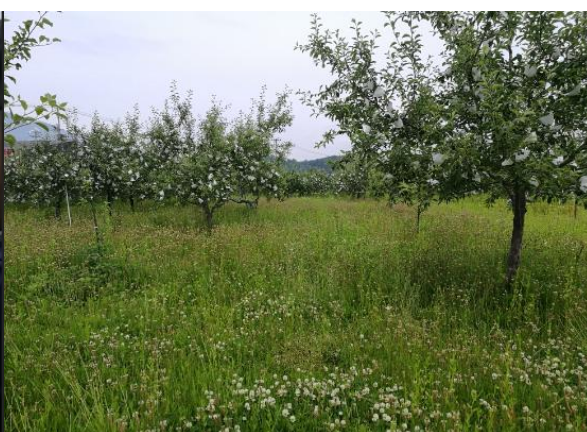
图 12-11 木村秋则先生的苹果园