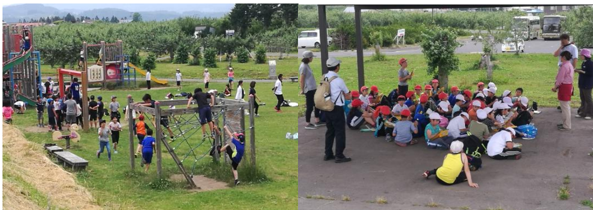
图 12-13 在苹果公园玩耍和上课的青森小学生

几天的考察使我对日本的苹果生产有了更多的了解，中国和日本有同样的地少人多国情，日本苹果产业的发展模式对我们很有参考价值。与日本相比，中国很多苹果产区海拔更高，昼夜温差大，具备生产优质苹果的自然条件；降雨量少于日本，不利于病害的流行，使得我们全年打药次数少；加上劳动力成本低于日本，所以现阶段更多的苹果还能够实行套袋。中国人多、市场潜力大，对苹果提质增效的诉求十分强烈，这些都会促使中国苹果产业的快速发展。今后，还需要借鉴国外的先进经验，发扬大国工匠精神，努力奋斗十几年，相信中国的苹果产业一定会上升到一个更高的台阶。