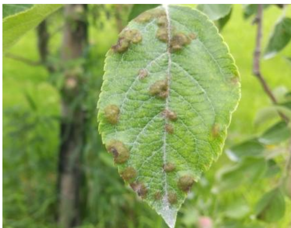
图 12-8 苹果黑星病在叶片上的症状