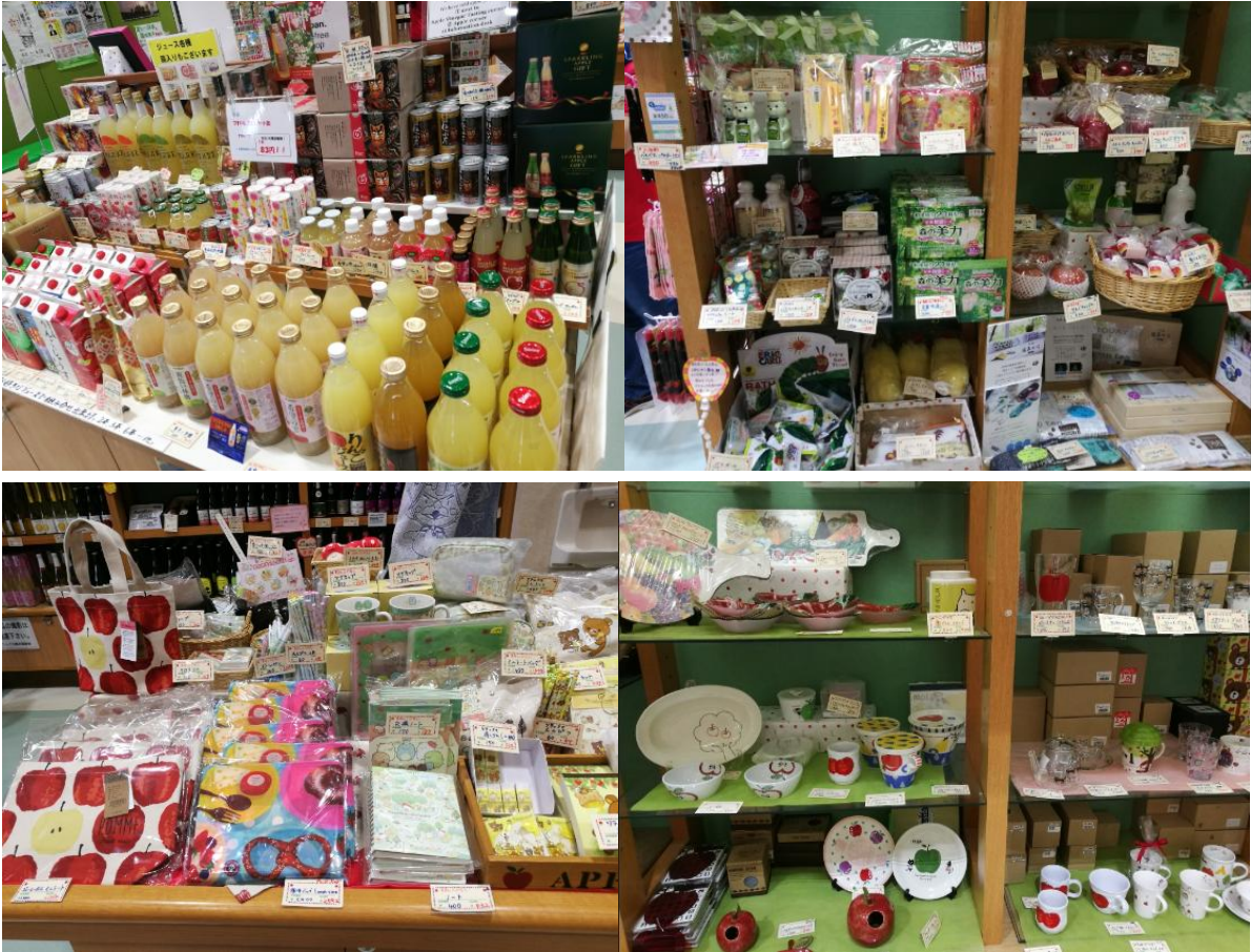
图 12-12 琳琅满目的苹果主题产品

别具风格。如在会见青森知事这种庄重的场合，双方参会人员都穿了正装，而三村申吾知事穿的却是印有很多苹果图形的白色外套，他的出现一下子活跃了现场气氛，出乎我们意料的是外套里面竟套了4层白T恤衫，脱下每一层都印有当地的农产品和风景，这种独特的宣传方式，让人耳目一新，印象深刻。在参观弘前苹果公园时，除了观看园内种的上百个来自国内外的品种材料外，还观看了室内众多的以苹果为主题的产品（图12-11），包括苹果酒、苹果醋、苹果汁、苹果酱、苹果茶、各式苹果糕点、苹果化妆品，以及印有苹果的衣、帽、笔、杯、玩具等等，各色产品，琳琅满目。中午在公园吃的是苹果拉面、苹果炒饭和苹果汤等，味道鲜美，价格不菲。还有一幅让人过目不忘的场景是对青少年的教育。在苹果公园我们看到很多小学生在各种娱乐设施尽情玩耍，一段时间以后，老师将孩子们组织在一起上课，所讲内容我们不是很清楚，但是看到孩子们那股认真劲儿让我感受到教育的力量，我想这些孩子们长大以后无论从事何种工作，都会以不同的方式助力于家乡的苹果产业，这种教育方式很值得我们借鉴。