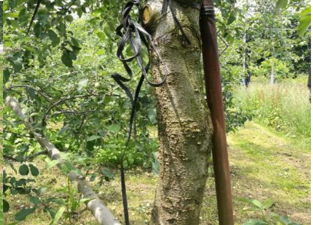
图 12-7 苹果枝干轮纹病的症状