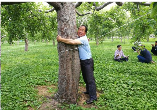
图 12-4 处于结果盛期的苹果树