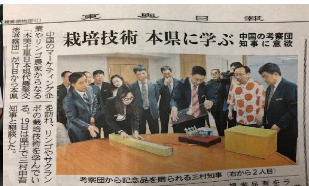
图 12-2 日本东奥日报对考察团宣传报道